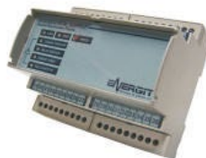
EMA, EMCM, EMCT